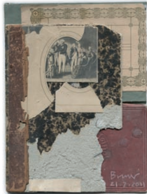
„Ohne Titel“, Collage, 17,0 x 22,5 cm, 2011