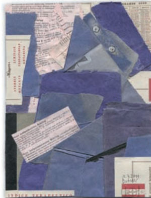
„Ohne Titel“, Collage, 17,0 x 23,0 cm, 2011