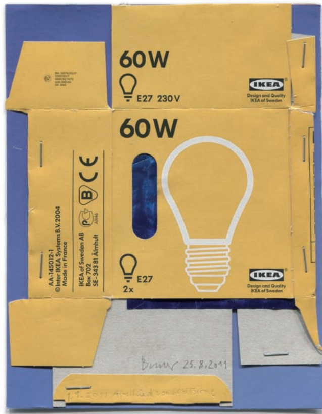
„Abschied von 60 W Birne“, Collage, 15,0 x 20,0 cm, 2011