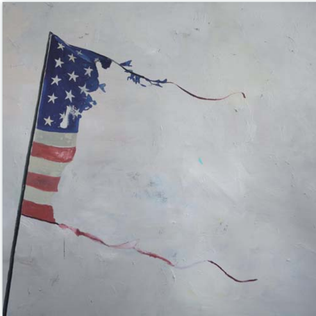
„Changes“ (Detail), Öl/Leinwand, 200 x 150 cm, 2012