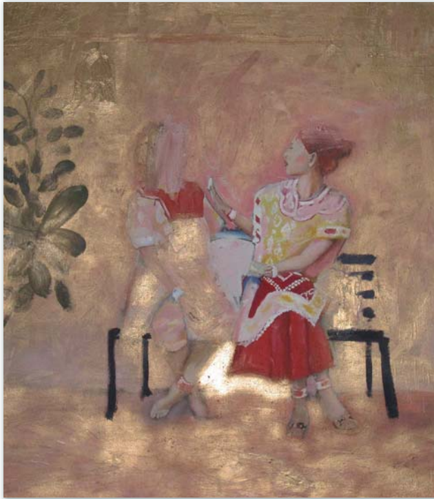
„Thailänderinnen am Jerewanschrein“, Öl/Lw., 100 x 110 cm, 2011