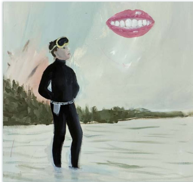
„Taucher“, Öl/Leinwand, 50 x 60 cm, 2008