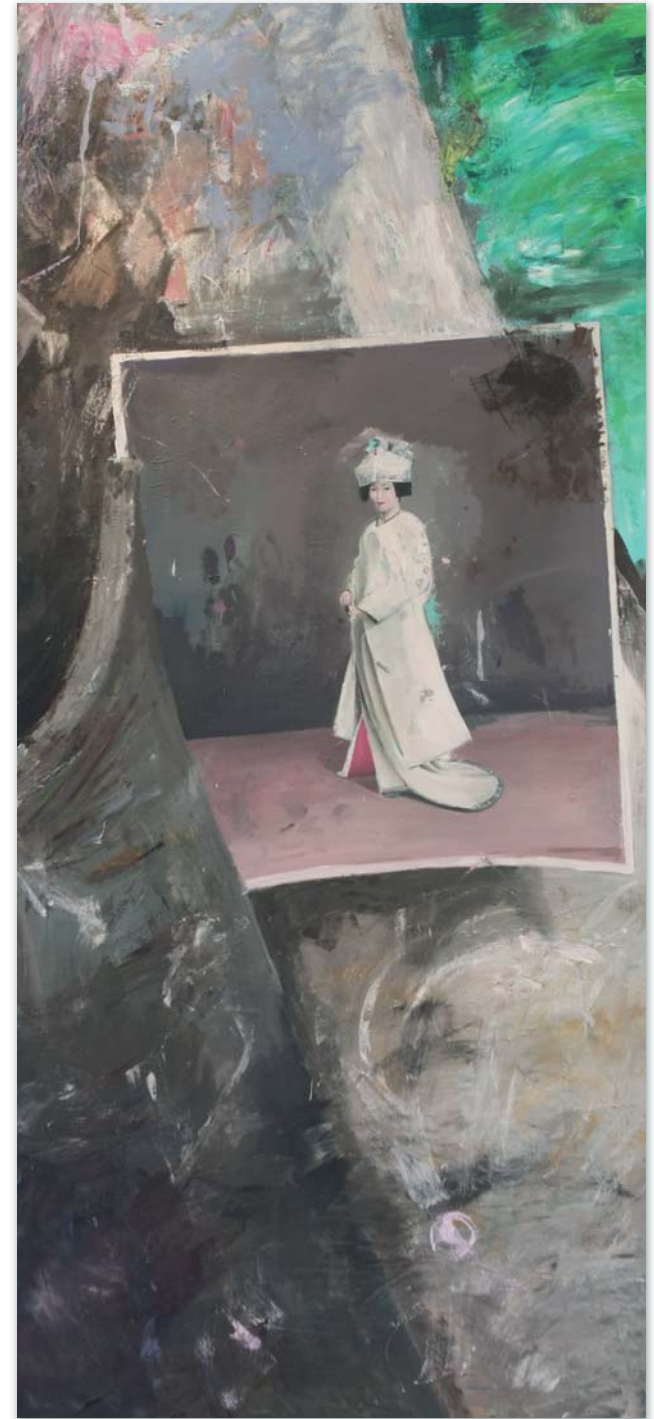
„o. T. / Japanerin“ (Detail), Öl/Leinwand, 140 x 280 cm, 2011