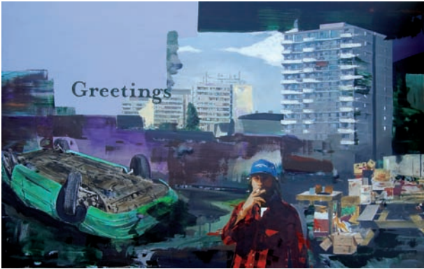
„Greetings“ (2012) Prämiert beim LICC 2012 (London International Creative Competition) Acryl auf Leinwand, 105 x 150 cm

MALEREI: PAOLO DE BIASI (* 1966, lebt in Treviso/Italien)