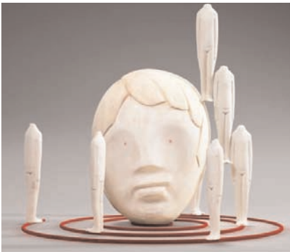
„Kopflos“ (2011) Miniaturmodell der Installation zur 54. BIENNALE DI VENEZIA 2011 Lindenholz unter Plexiglas, 35 x 35 cm 2.400,-