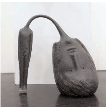
„testa pesante / Schwerer Kopf“ (2007) Bronze, Höhe: 85 cm, Breite: 78 cm / UNIKAT 18.000,-