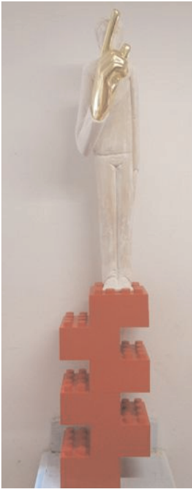
„Schweigen ist Gold“ (2012) Lindenholz und Blattgold, Höhe: 145 cm 6.500,-