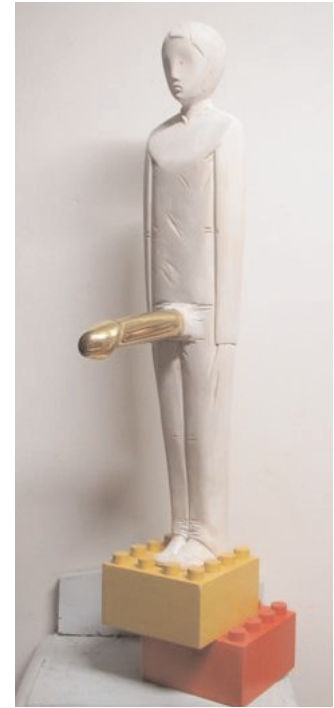
„c i ho d oro / Hab's aus Gold“ (2012) Lindenholz und Blattgold, Höhe: 110 cm 6.000,-