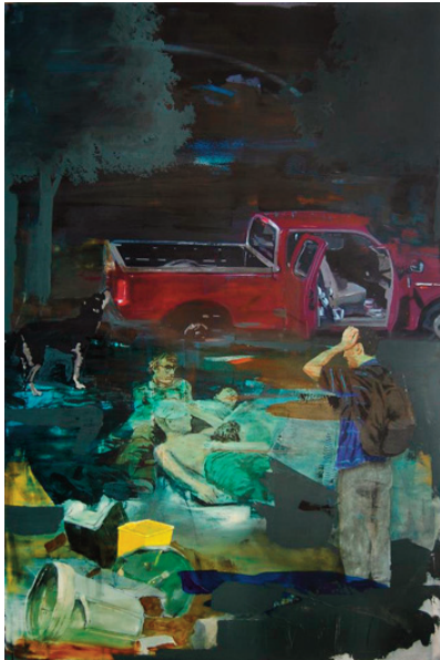
„Déjeuner“ (2013) Acryl auf Leinwand, 150 x 105 cm